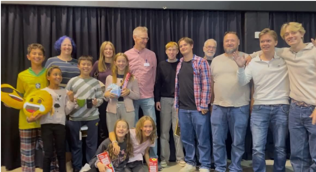
Støtte fra BK Missklikk og Bufdir: Rause med ros og premier. Vi kommer tilbake!