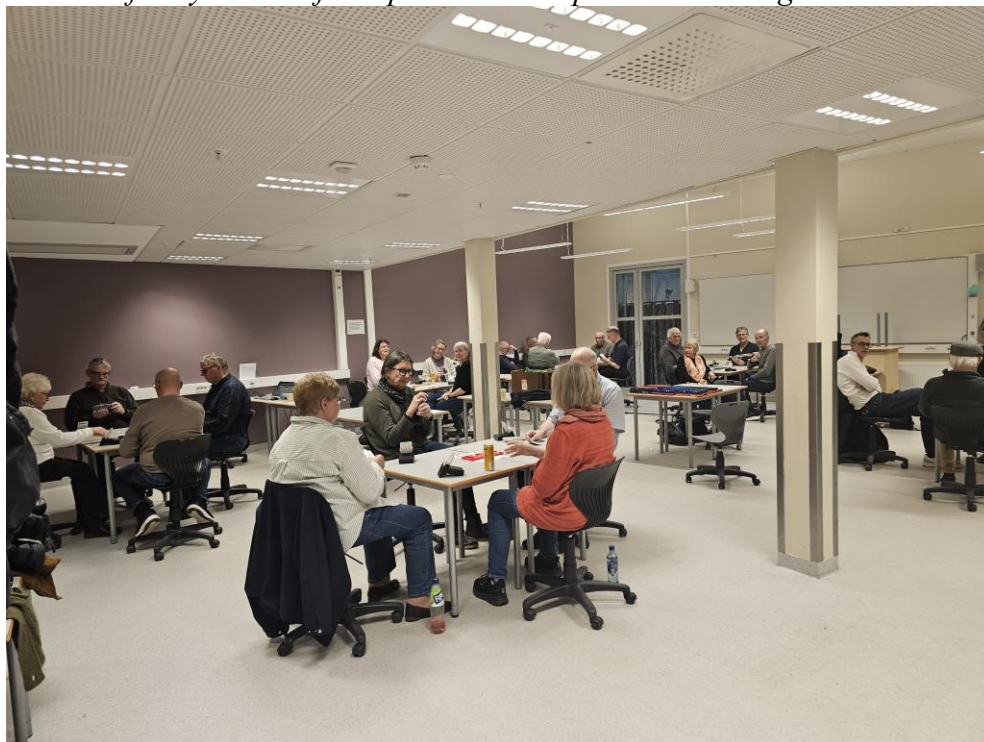
Bilde fra nytt lokale fra september 2025 på Askim videregående skole