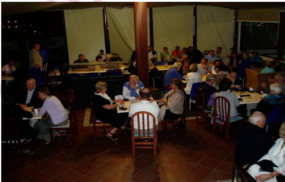
Mange som spiller bridge senere på kvelden også