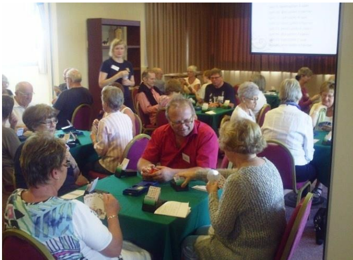
Både koselig prat ved bordet