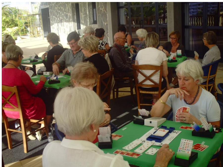
Her fra spillingen i teltet utenfor Atlante i 2014.

Start for både undervisning og turneringsaktiviteter blir mandag 14. november. Hver dag (ikke søndag 22.) fra kl.16.00 til ca kl. 20.00.