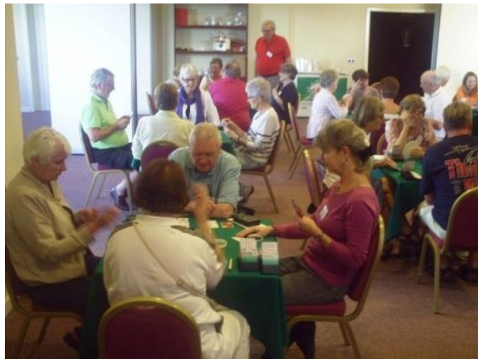
og dyp konsentrasjon i spillet.

Nedenfor et par bilder fra spillingen i Atlante november 2014.