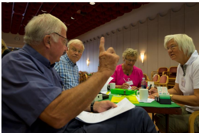
Fra en gruppediskusjon på en tidligere Begynnerfestival.

Begynnerfestivalen avholdes dagene før Norsk Bridgefestival, og deltakerne får muligheten til å spille en Begynnerturnering i Kongstenhallen på åpningsdagen av Norsk Bridgefestival.