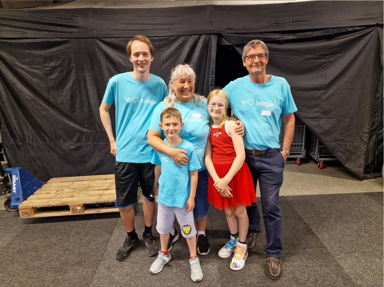
3 generasjoner Bakke på juniorleir, 2 deltakere og 3 instruktører 😊