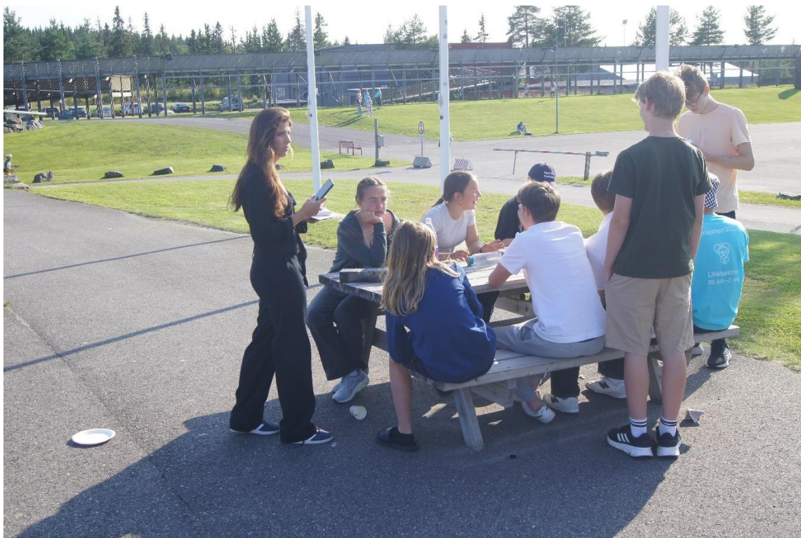
Juniorer under spisepause på juniorleiren