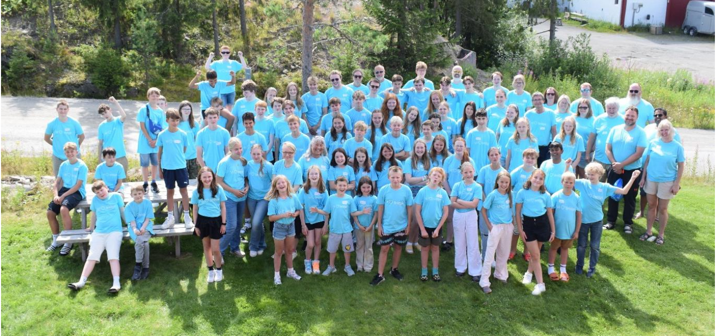
Gruppebilde fra juniorleiren på Lillehammer.