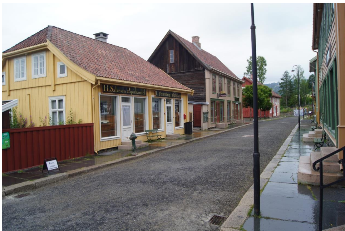
Gateparti fra Maihaugen