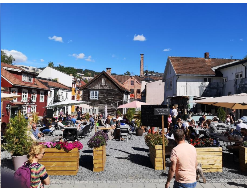
Uterestaurant i Storgaten