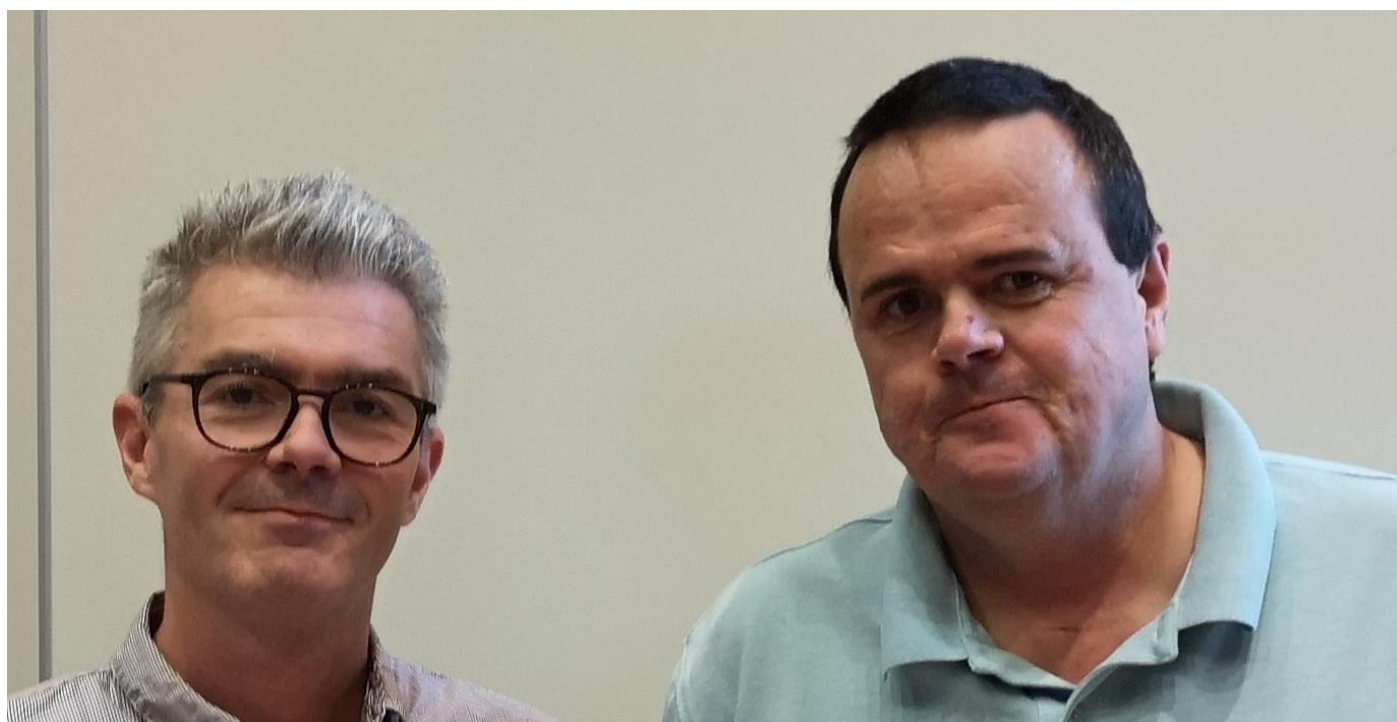
Thorfinnson og Mikkelsen i flytsonen!

Dermed ble det 13 IMP inn til Sølvknekt, som vant 19-9 og ligger på 2.plass etter 3 runder.