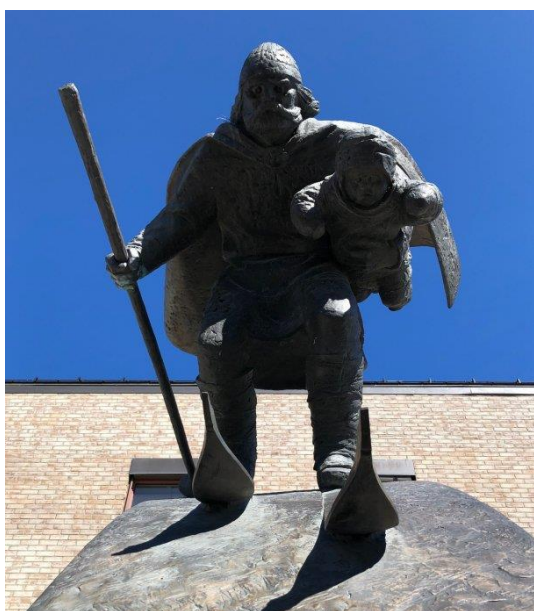
Birkebeiner fra Lillehammer sentrum