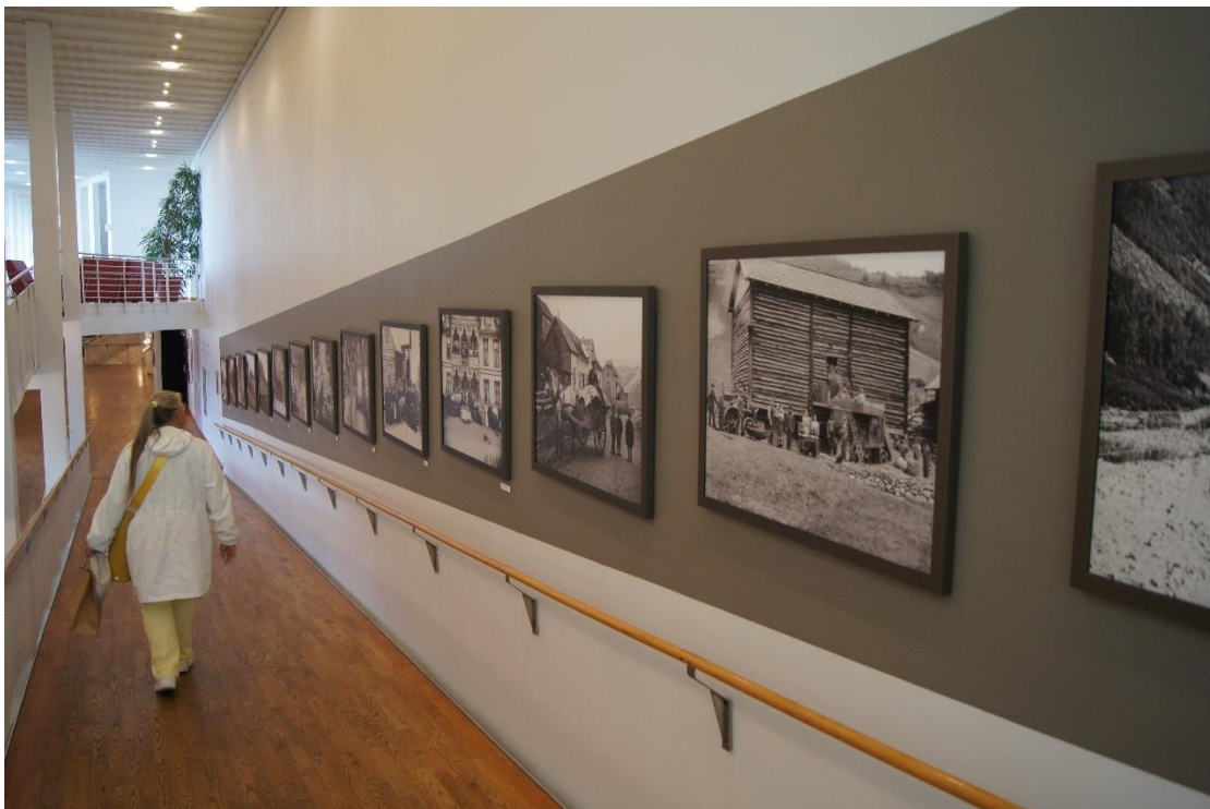
Galleri over viktige hendelser i Lillehammers historie

Og husk på Maihaugen ligger også Postmuseet og Norges Olympiske Museum, som er en hyllest til idretten, til bragder og helter, til den olympiske idé og til folkefesten i -52 og -94. Kjøper du billetter til begge, samtidig – får du rabatt. Rekker du ikke begge samme dag – gi beskjed, så stempler de billetten slik at du kan komme tilbake en annen dag – i løpet av en uke.