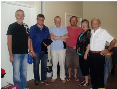
Premievinnere i gruppe A