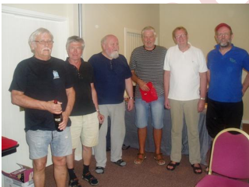
Øvrige premievinnere i gruppe A