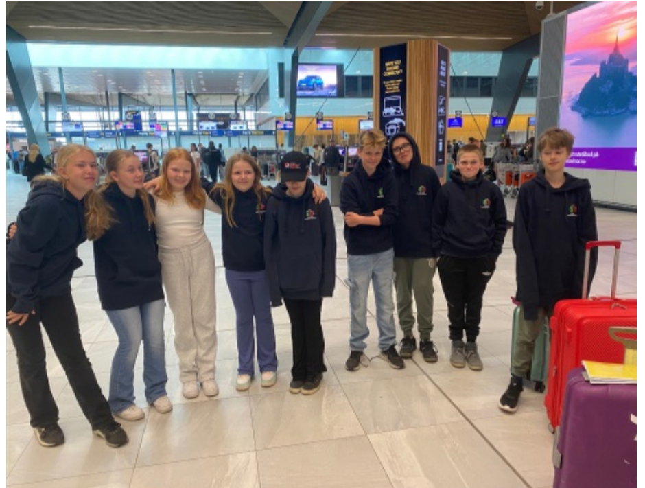
MEISTERSKAP: Gjengen som starta i skulemeisterskapen.

— Det vart veldig jamt. Jentene spelte 11 rundar á 5 spel, altså 11 timar med bridge. Dei vann med knappe 12 poeng, fortel Vangdal.