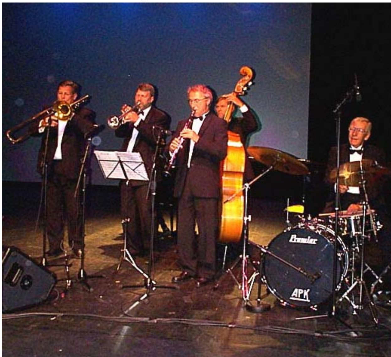
SVINGENDE: Bratsberg Amt serverte svingende jazztoner.