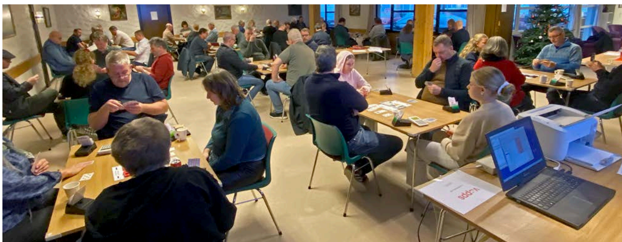
28 par deltok i juleturneringa denne gongen.