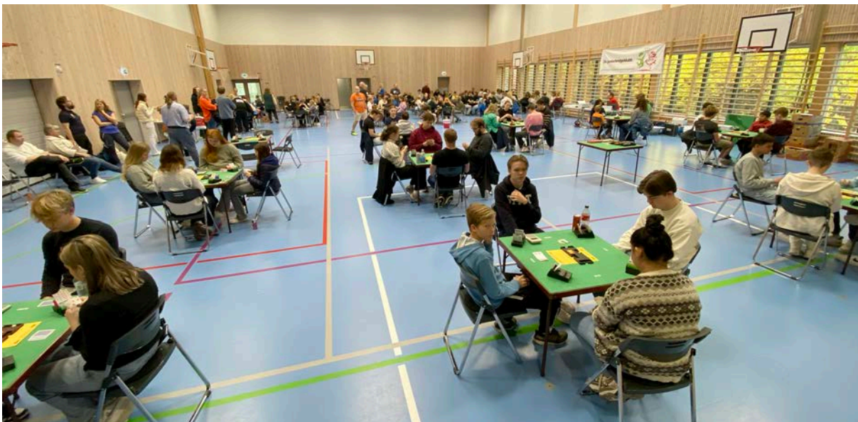
Gymsalen på Os ungdomsskule er eit fint spelelokale.