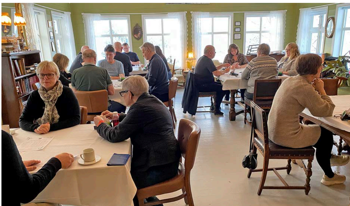
Flotte spelelokale på Haaheim