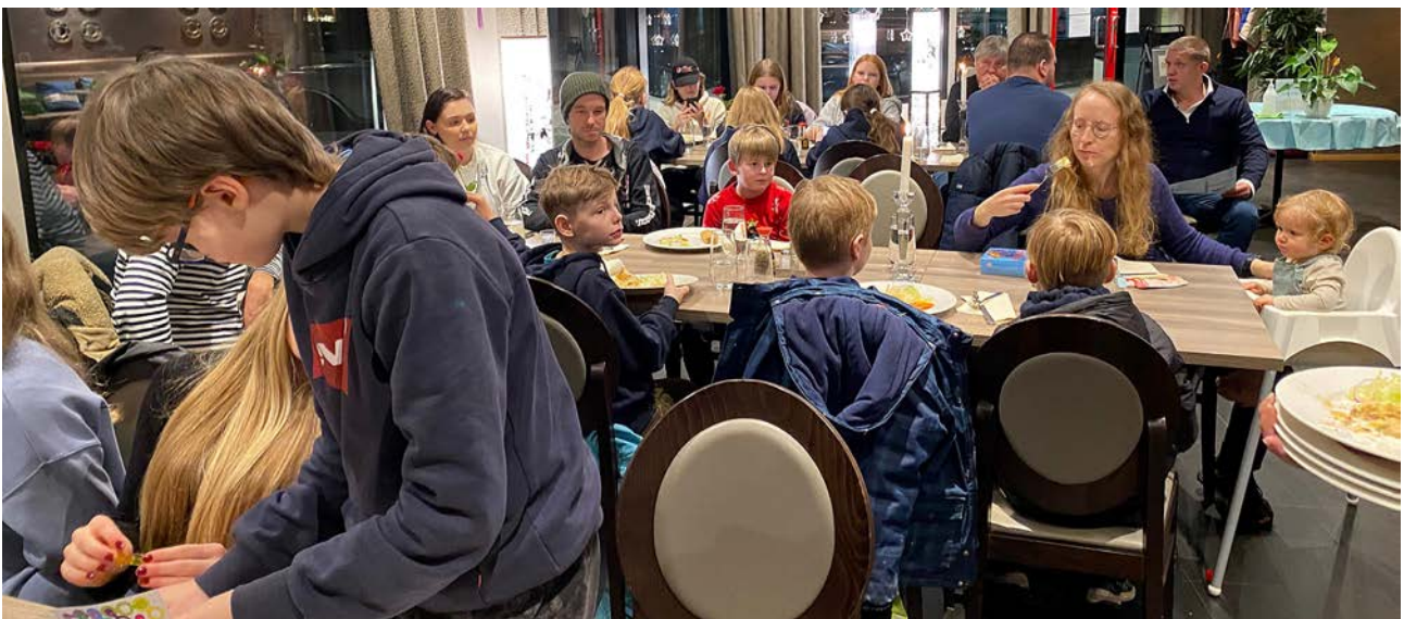
Juniorklubben sitt julebord, på Rice denne gongen.