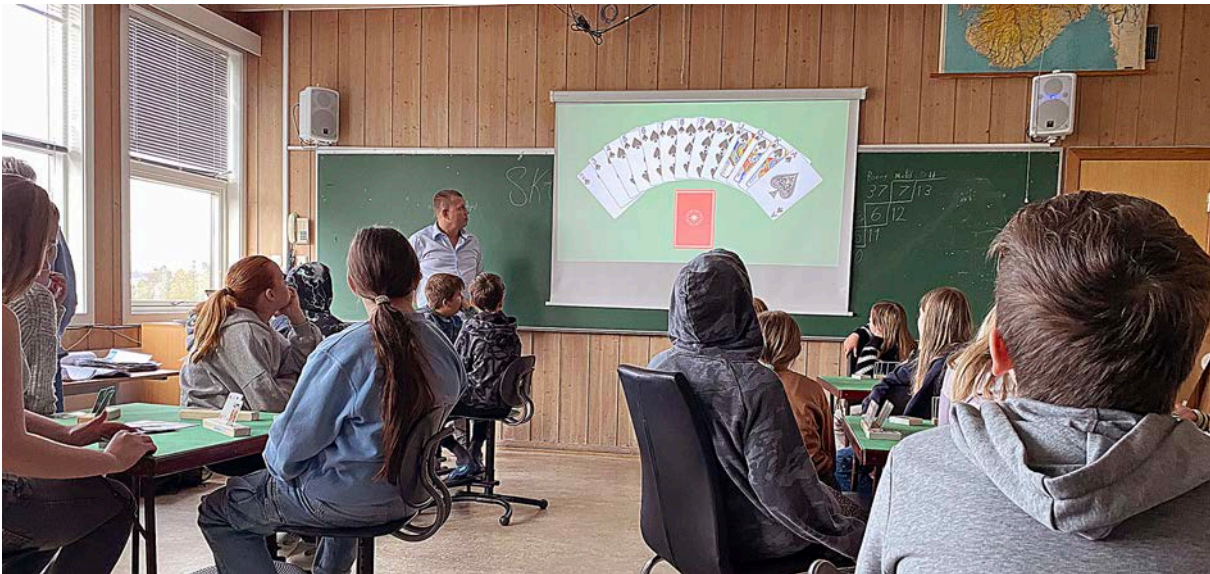
Frå skulebesøket på Lunde 25. september 2025

Neste sesong er det i tillegg til vidareføring på Lunde òg planar om å gå i gang på Nore Neset barneskule. Om nokon har lyst å vera med å arrangera er det bare å ta kontakt med Tarjei.