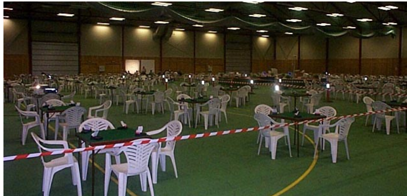
GOD Plass: Hovedbygget på Stevneplassen er på hele 3.150 kvadratmeter

For første gang i Norge skal det samles imponerende (forhåpentligvis) mye konsentrasjon over så mange kortstokker på samme tid under ett tak. Vi i arrangørstaben har bestrebet oss på at våre gjester her skal få de beste forhold som tenkes kan for utøvelse av sin idrett og sin hobby, og ønsker hver og én hjertelig velkommen!