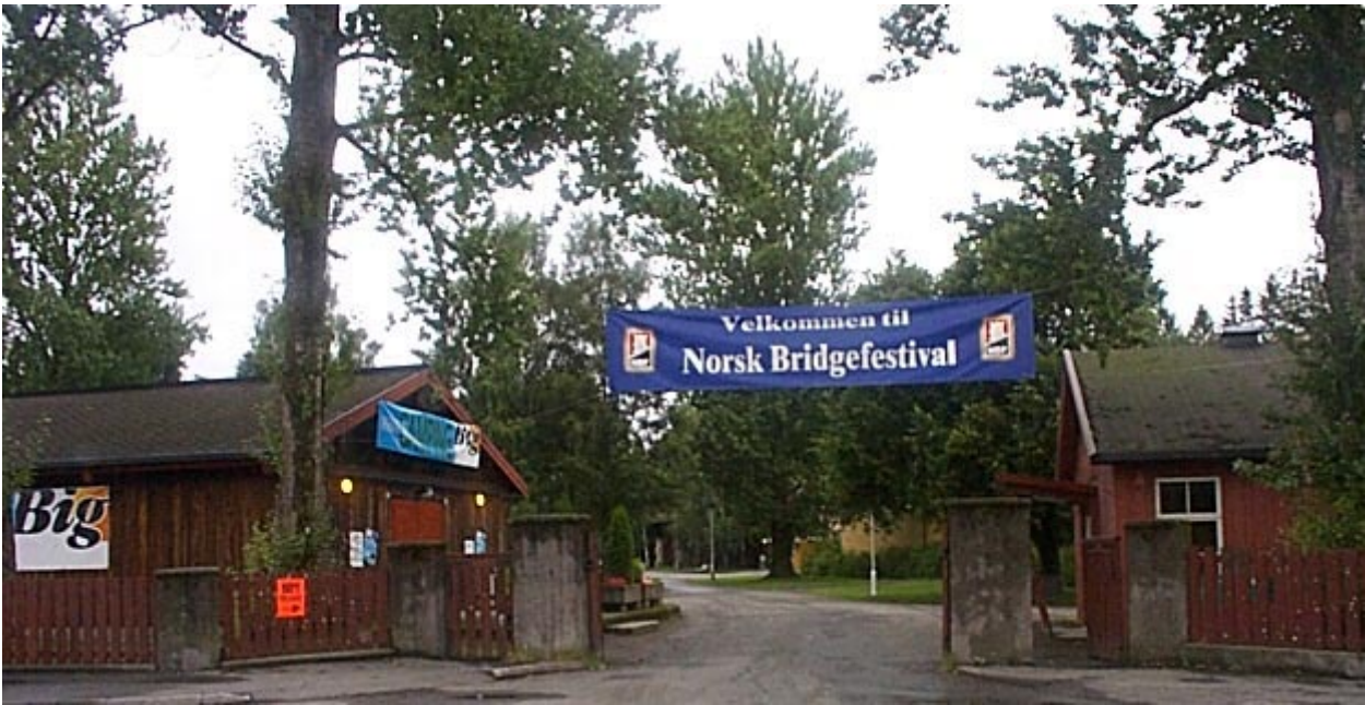
INNBYDENDE: Inngangspartiet til Stevneplassen er riktig så innbydende. Spesielt med seilet til Norsk Bridgeforbund.