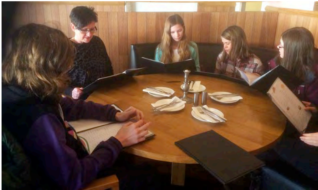
Pause, på Capri pizza-restaurant.