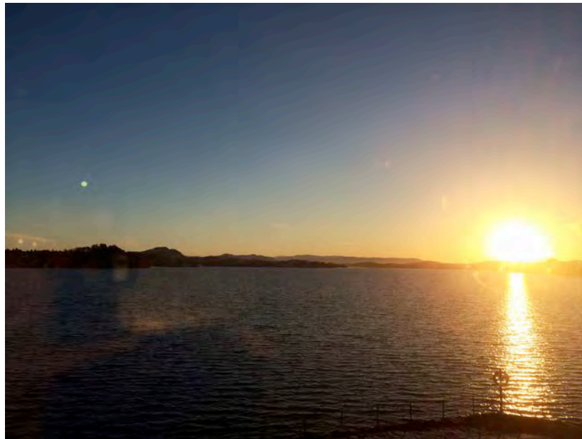
Soloppgang over Herdla.