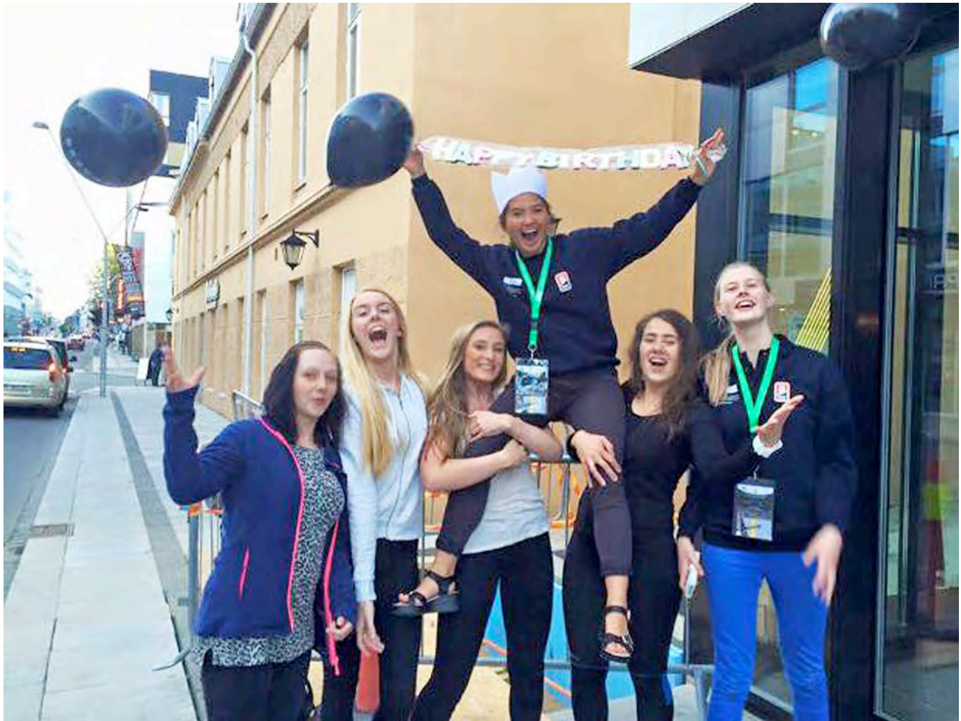
Bursdagsfeiring under ungdoms-EM