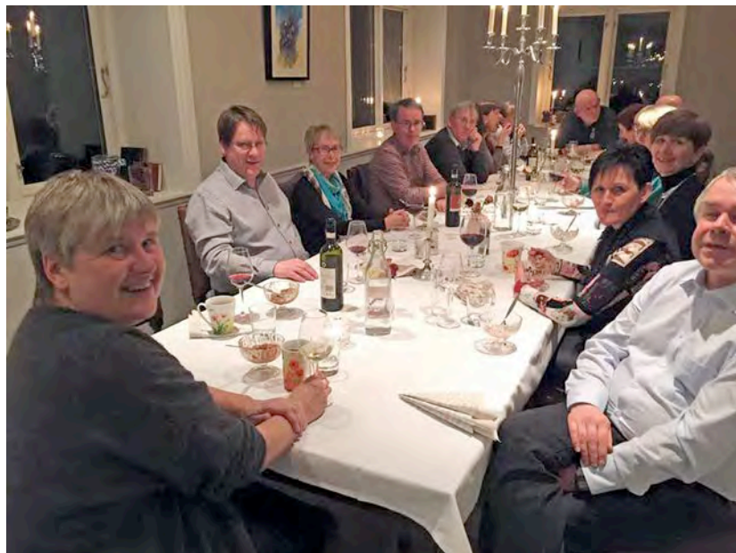
Alltid god mat og god stemning på Herdla. Her frå middagen laurdag kveld.