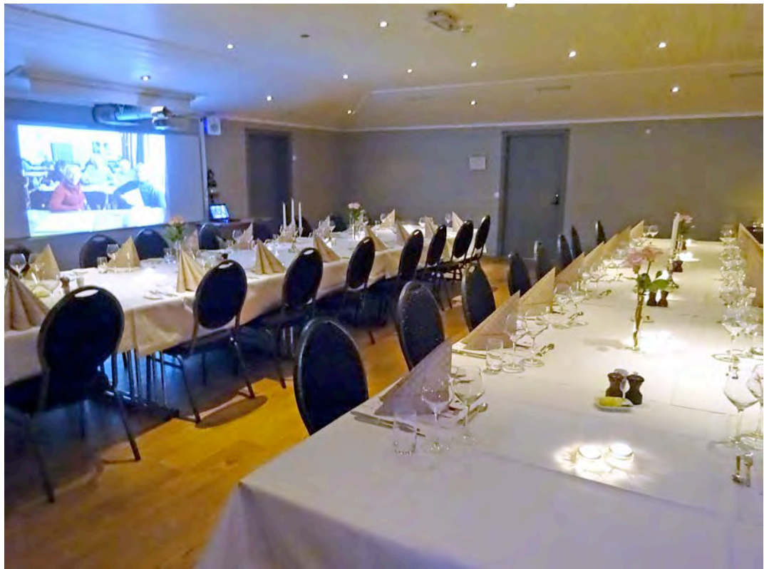
Bjørnefjorden Gjestetun pynta til festmiddag.

Her følger nokre bilete frå festen på Gjestetunet: