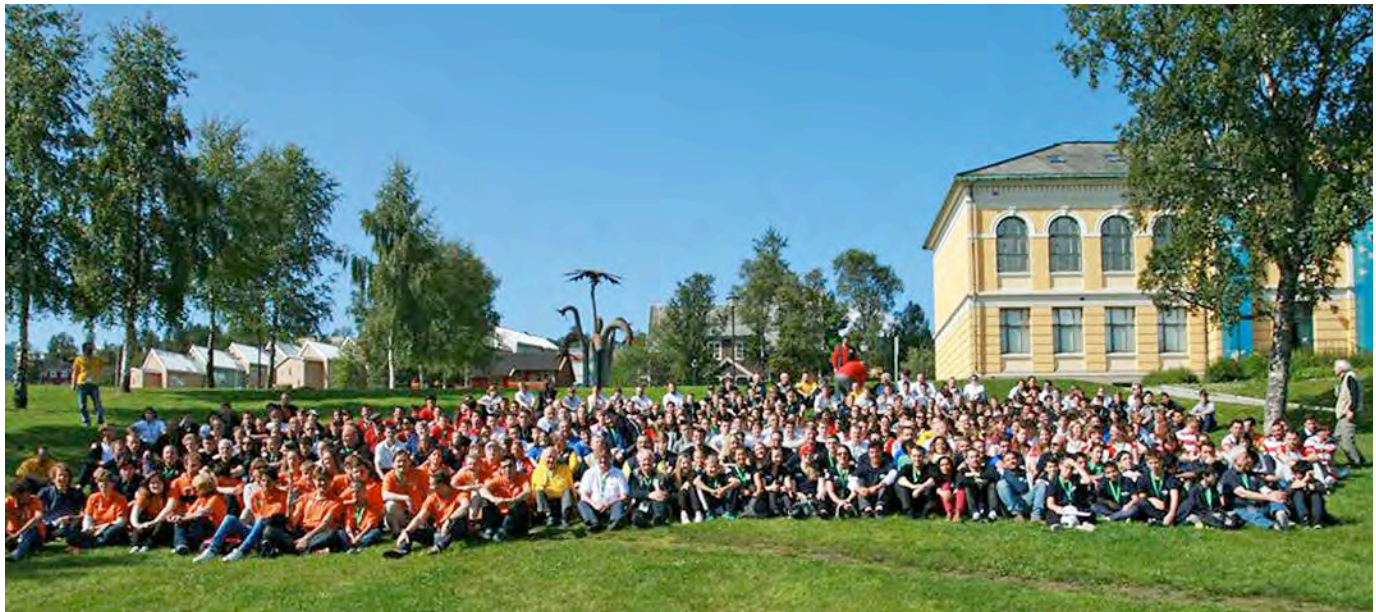
Alle spelarar og lagleiarar samla.