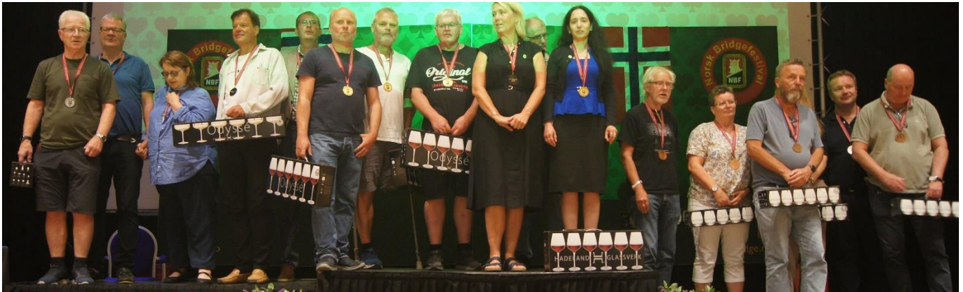
Dagens medaljevinnere i damer, veteran og monrad par