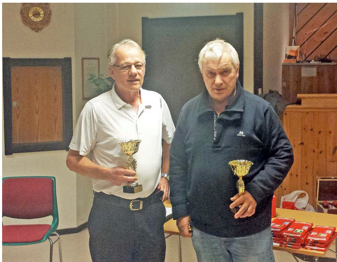
Årets klubbmeistrar; frå premieutdelinga siste spelekveld før jul.