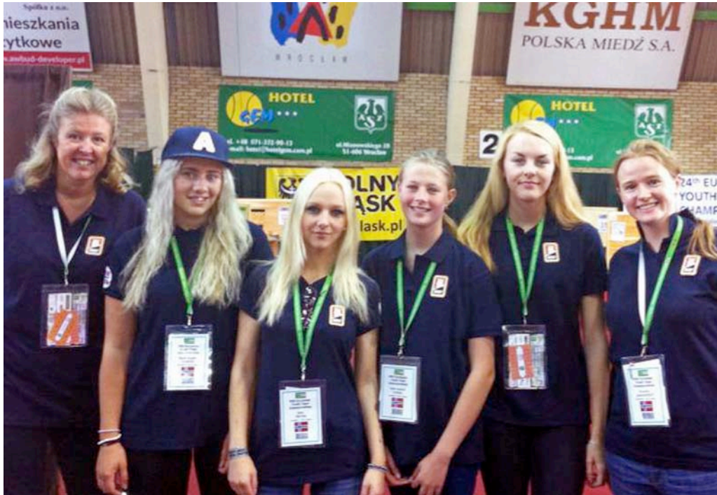
Det norske jentelaget som tok 6. plass i Polen sommaren 2013.

nasjonar blir det likevel VM-plass. Junior-VM går frå 13. - 23. august 2014 i Istanbul, Tyrkia.