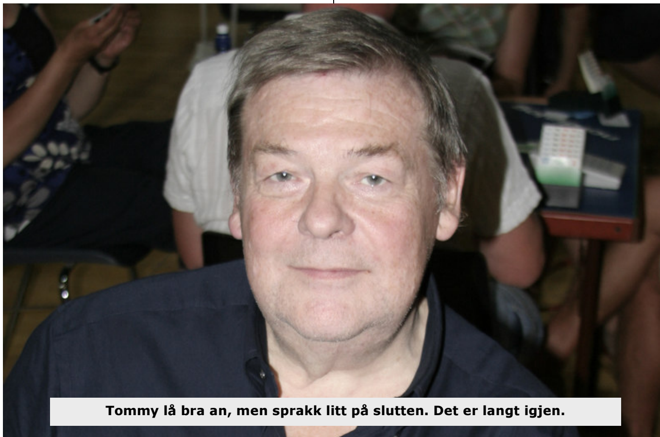
Tommy lå bra an, men sprakk litt på slutten. Det er langt igjen.

Jeg trenger ikke fortelle deg hvilket par som var mest fornøyd med scoren 300 til ØV.