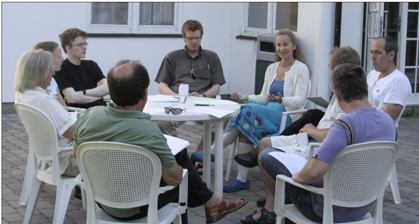
Fra et gruppearbeid under årets Bridgelærerkurs.

Et nyttig kurs, og med noen nødvendige justeringer kan arrangøren forvente stor deltakelse i årene framover