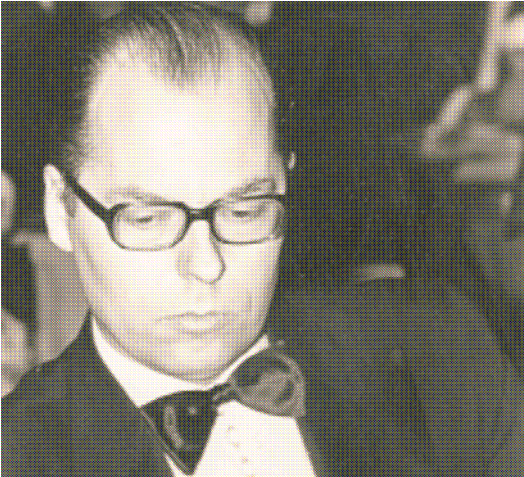
fra storhetstiden på 70-tallet..

Jeg tror nok at du kan lære mye, men for å bli en virkelig god spiller, må du også ha forståelse for spillet (talent).