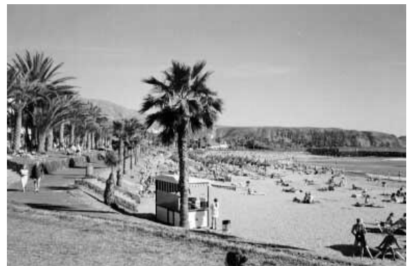
Playa de la Vistas er den største av de tre strendene i Los Cristianos.

Nede ved havnen har Fred Olsen ekspressbåter med daglige avganger til La Gomera og El Hierro. Til La Gomera tar det en knapp time, til El Hierro noe lenger.