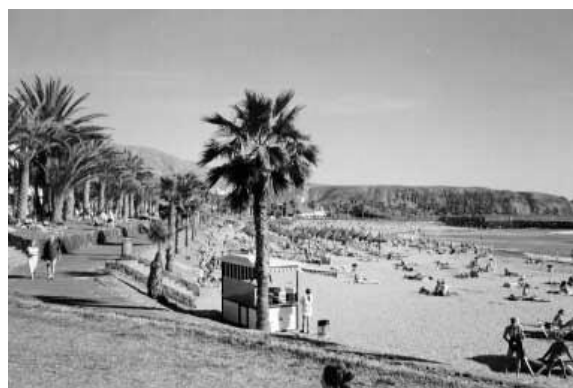
Playa de la Vistas er den største av de tre strendene i Los Cristianos.

Nede ved havnen har Fred Olsen ekspressbåter med daglige avganger til La Gomera og El Hierro. Til La Gomera tar det en knapp time, til El Hierro noe lenger.