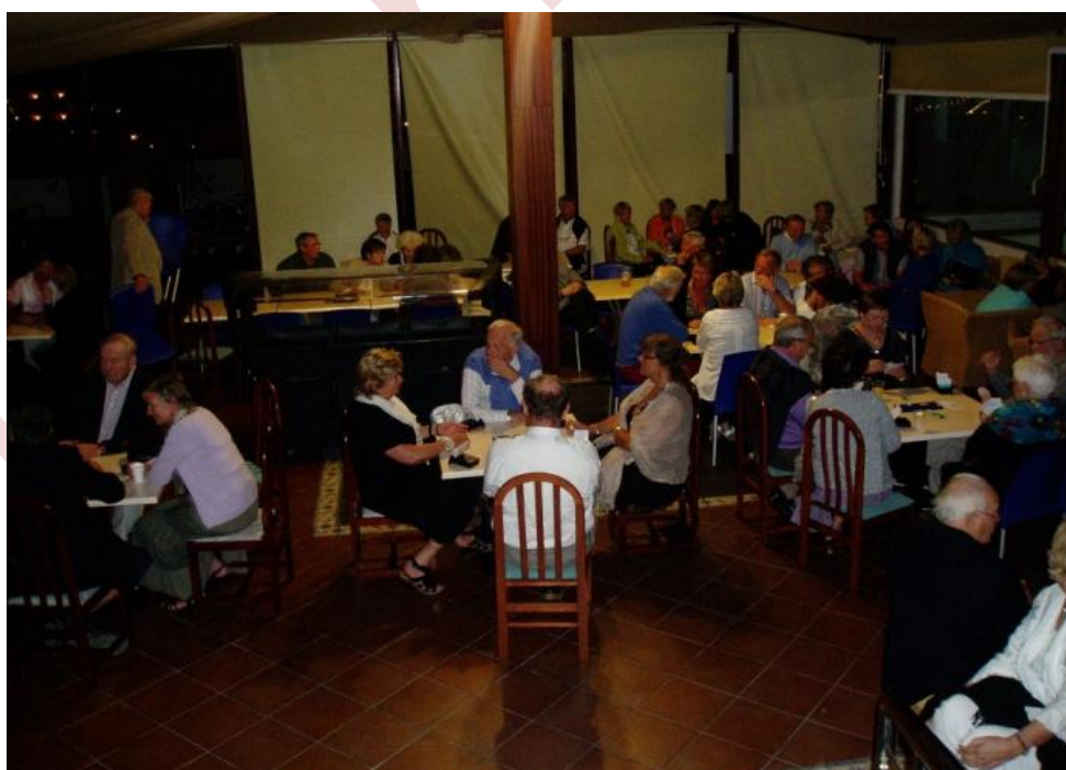
Mange som spiller bridge senere på kvelden også