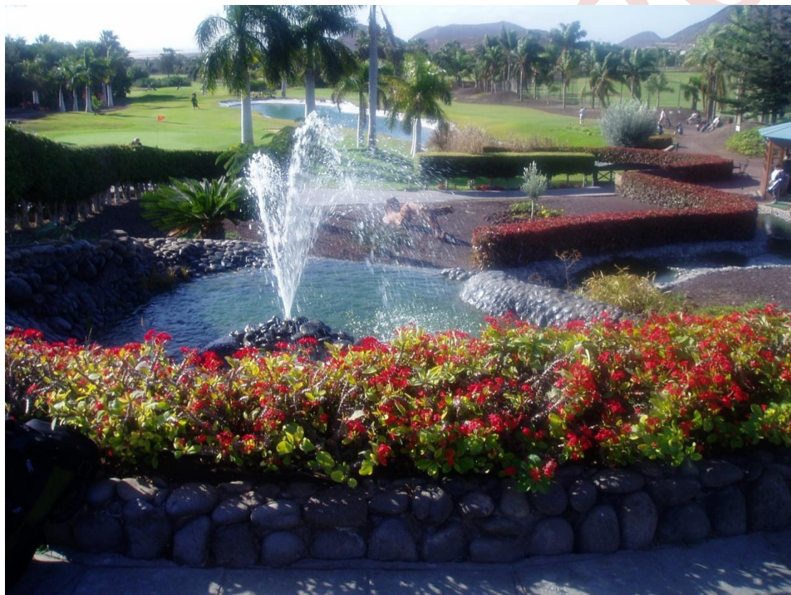
Her er et bilde fra flotte Los Palos golf på Tenerife.