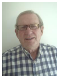
Knut holder også i år temabasert undervisning mandag kl. 10-11, tirsdag og torsdag kl. 15-16.