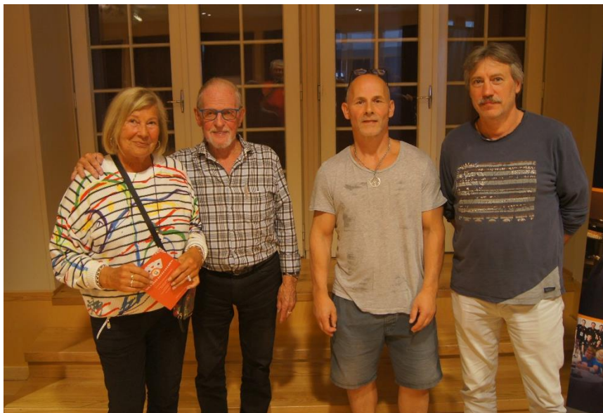
Første og 3.plassen på pallen. 2.plassen hadde gått!