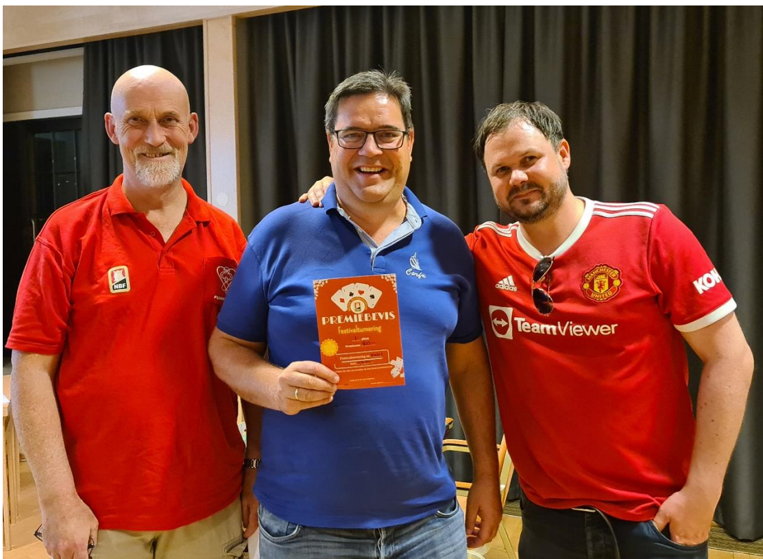
Turneringsleder og vinnerpar 😊