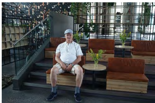
Redaktøren slapper av i resepsjonen