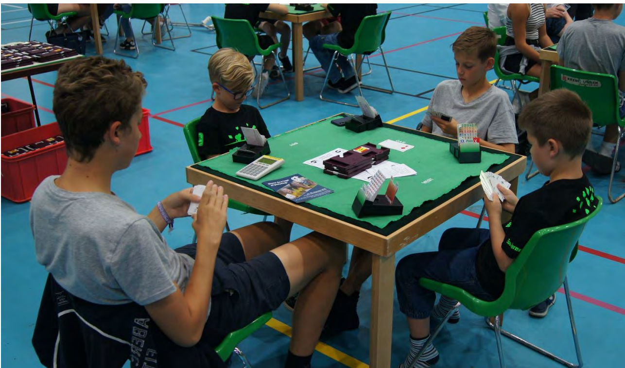
Fra NM junior 2018