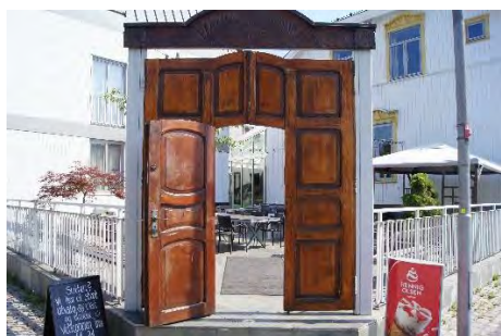
Inngangen til Tollboden

I kort avstand fra Drammenshallen ligger Tollboden med 127 rom og kveldsmat inkludert. Hotellet vil i tillegg selge lunsj til festivaldeltakere. Tollboden vil være vertskap for festivalquizen.