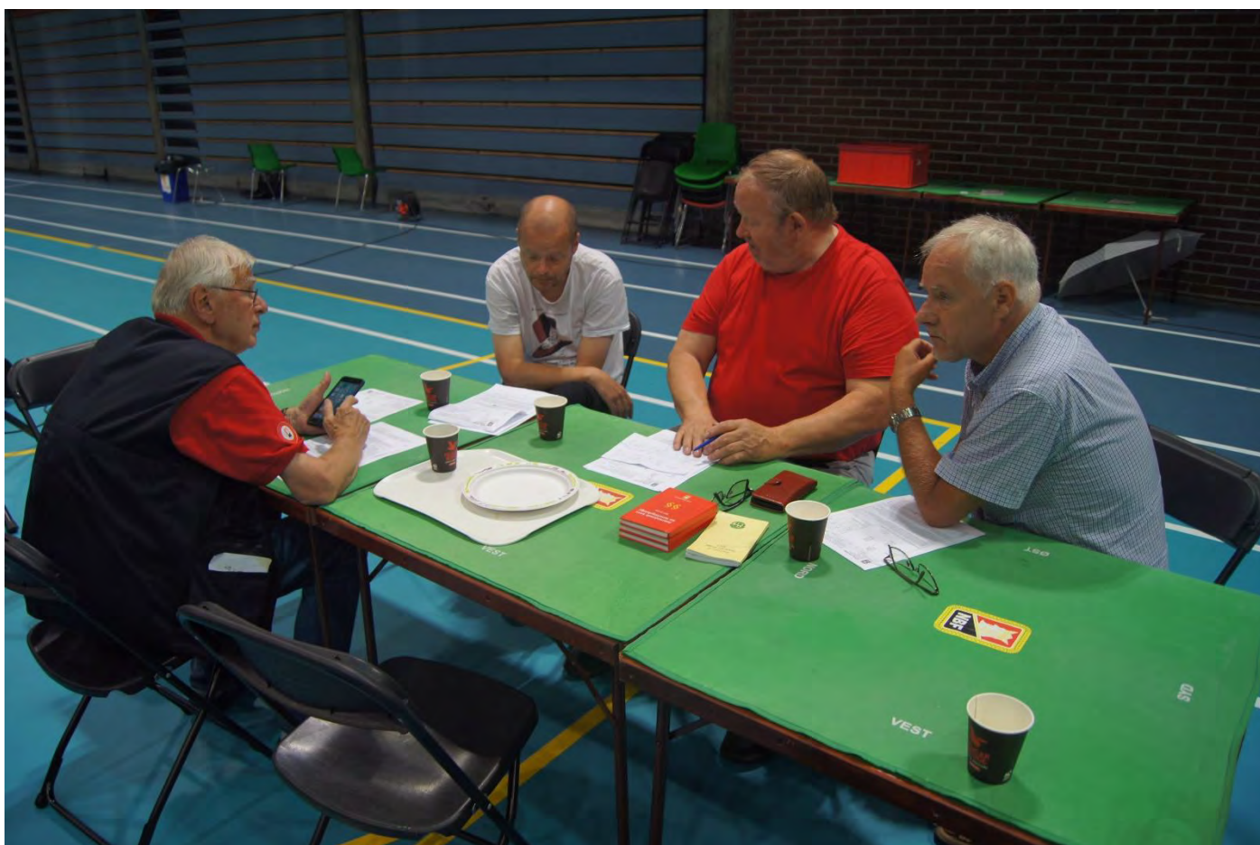
Appell-komiteé i arbeid på Bridgefestivalen 2018