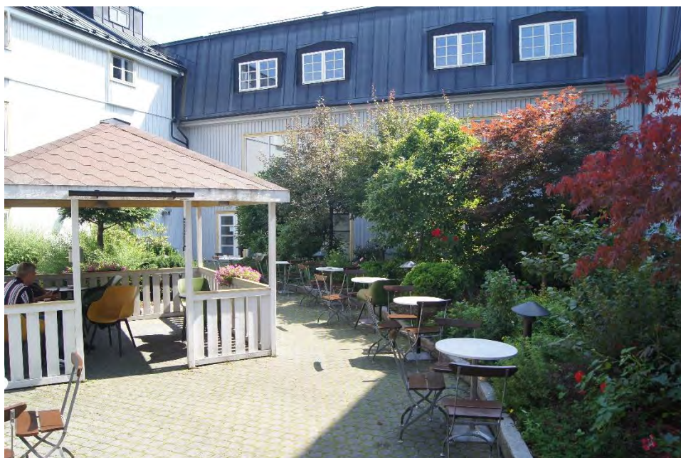
Fra bakhagen på Tollboden

For hver natt gjester avstår fra romrengjøring, vil hotellet donere en sum til Unicef. Sammen kan vi hjelpe flere." Staben på Bridgefestivalen har bedt om at deres rom bare blir rengjort hver femte dag, kanskje du kan bidra også?