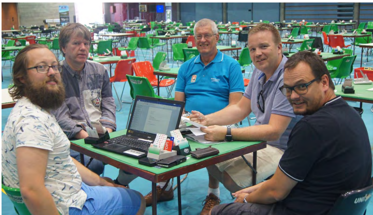
Et lite knippe bridge-journalister 2018

Svaret sendes til festivaloppgaver@vegar-naess.net med «Festivaloppgave nr. 1» i emne-feltet innen søndag 4. august kl. 23:59.