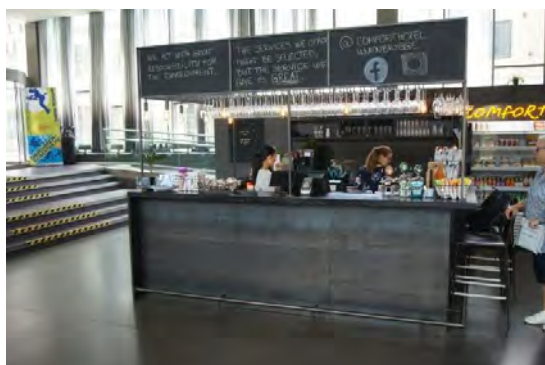
Resepsjonen/bar på Union Brygge