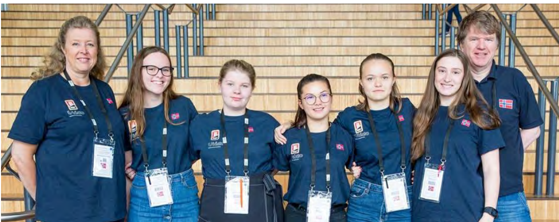
Norge U26 damer

Polen ble europamestere, med Ungarn på 2.plass og Nederland vant bronsemedaljene.