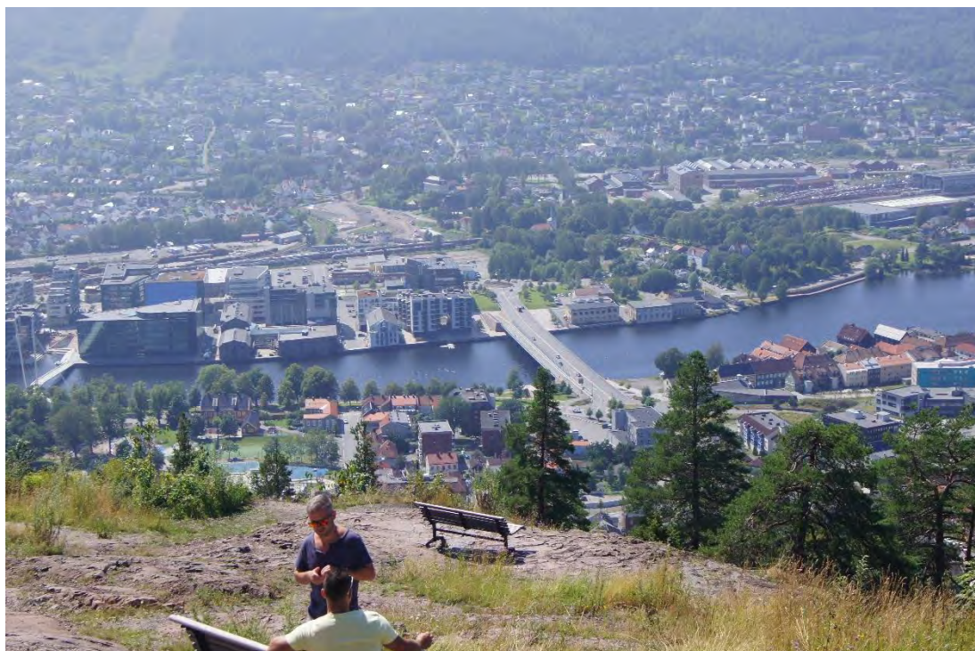
Vi var også på toppen av Spiralen !

Vi droppet dessert og/eller kaffe – det tok vi et annet sted, skal fortelle om det også – senere.