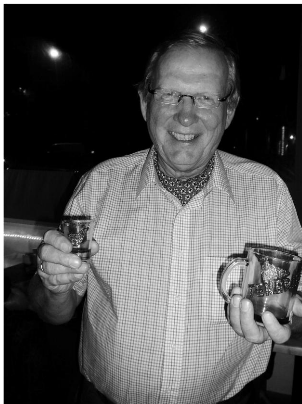
Knuts siste spilletips for denne gang.

Nå er det ingen sak å fange opp Vests kløver.