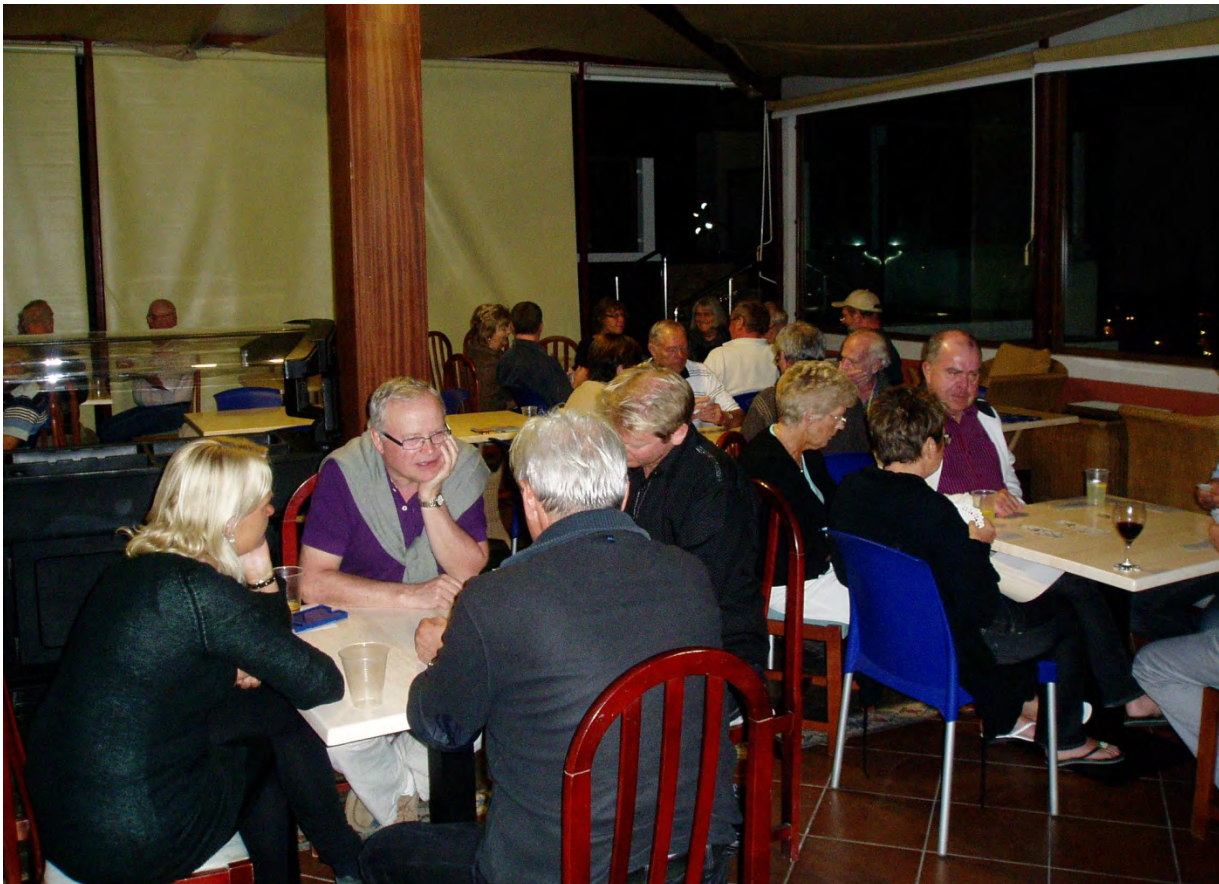
En kan kose seg med et glass vin og et slag kort i Bridgepuben!

Vi åpner puben mandag 5. januar etter middag (åpningstid ca kl. 21.00 -24.00). Drikkevarer serveres for øvrig kun i plastglass, og grunnen er at den ligger i et badeområde (regulert ved spansk lov). Det er varmeovner og tykke gardiner i lokalet, men det kan bli kjølig på kvelden, så kle deg gjerne litt ekstra godt. Og førstemann til mølla-prinsippet gjelder - i fjor var det i blant fullt.