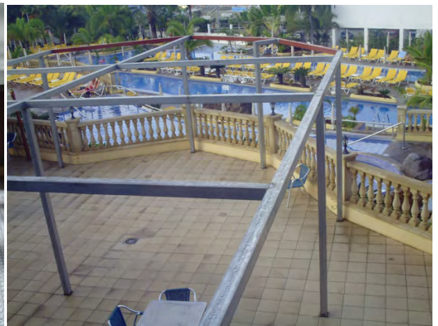
Konstruksjonen til "utvidelsen".