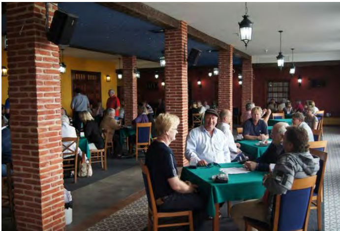
Fra spillelokalet i Atlante.

B-gruppen vil også denne gang spille i Atlante som ligger ved svømmebassengene rett ved hotellet (de tilhører også hotellet). For å få plass til alle, har hotellet satt opp et "telt" som gjør at en nå kan spille opp til 35 bord i B. Det kommer også til å settes opp varmeovner i "teltet", og fra januar i fjor er veggene nå "tettere".