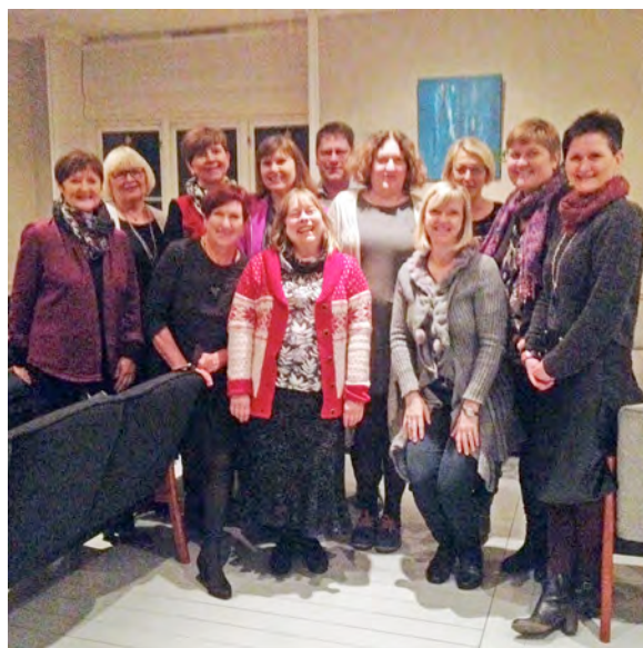
Heile Herdla-gjengen 2015 samla.