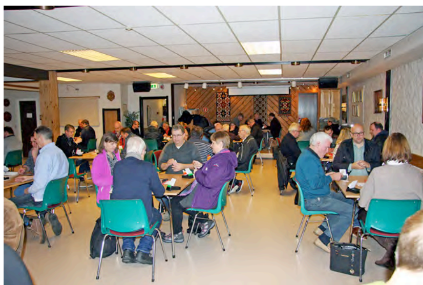
Fullteikna turnering denne gongen og. 35 par var med.