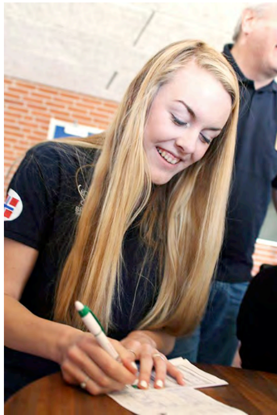
Samanlikning av lister. Ser ut til å vera ei god dette.