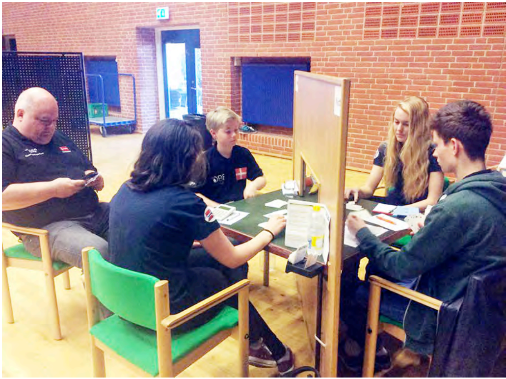
Frå kampen mot det danske U21-laget, ein kamp jentene tapte med nokre få IMP.