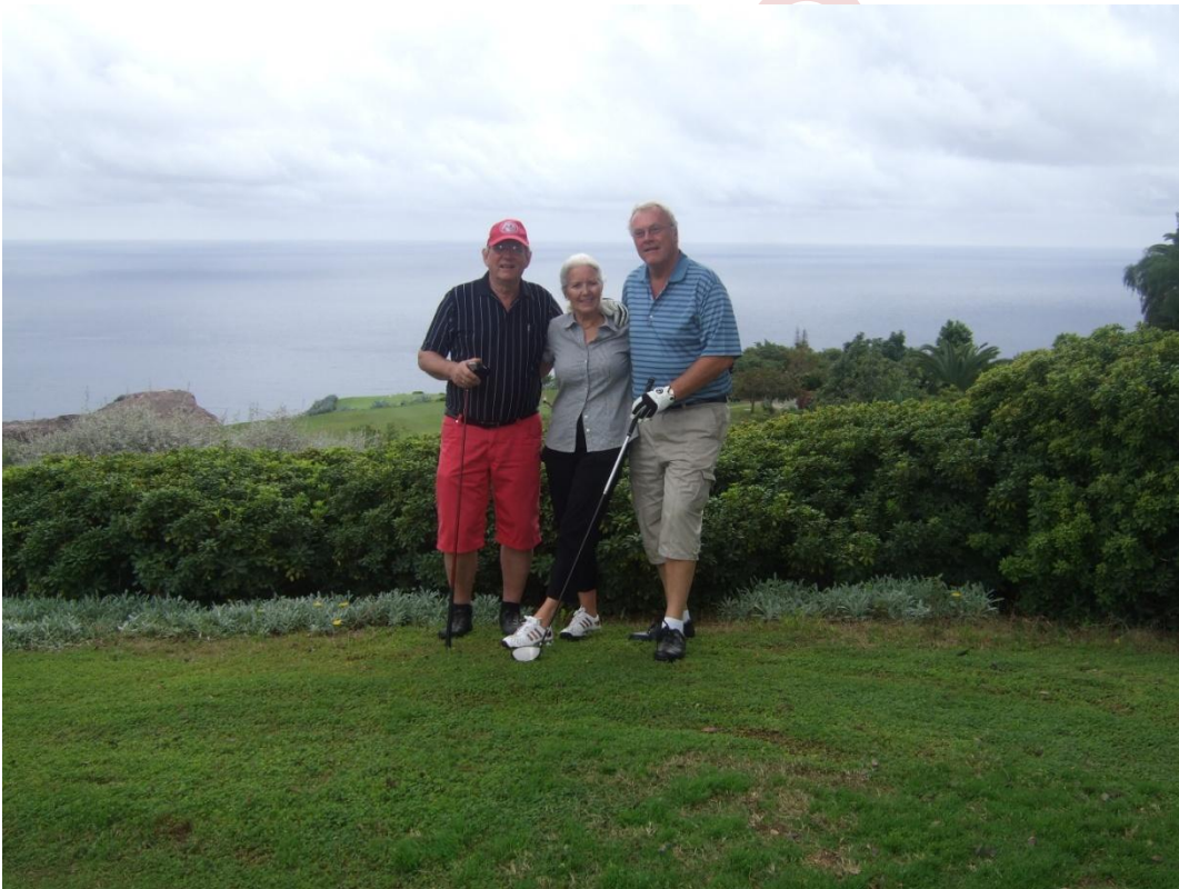
Golfmulighetene er mange på Tenerife.