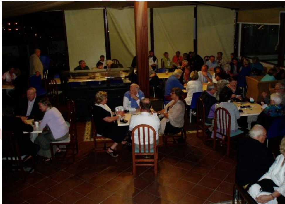
Mange som spiller bridge senere på kvelden også