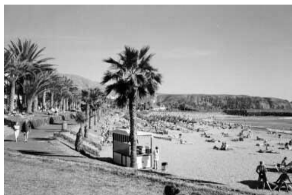
Playa de la Vistas er den største av de tre strendene i Los Cristianos.

Nede ved havnen har Fred Olsen ekspressbåter med daglige avganger til La Gomera og El Hierro. Til La Gomera tar det en knapp time, til El Hierro noe lenger.