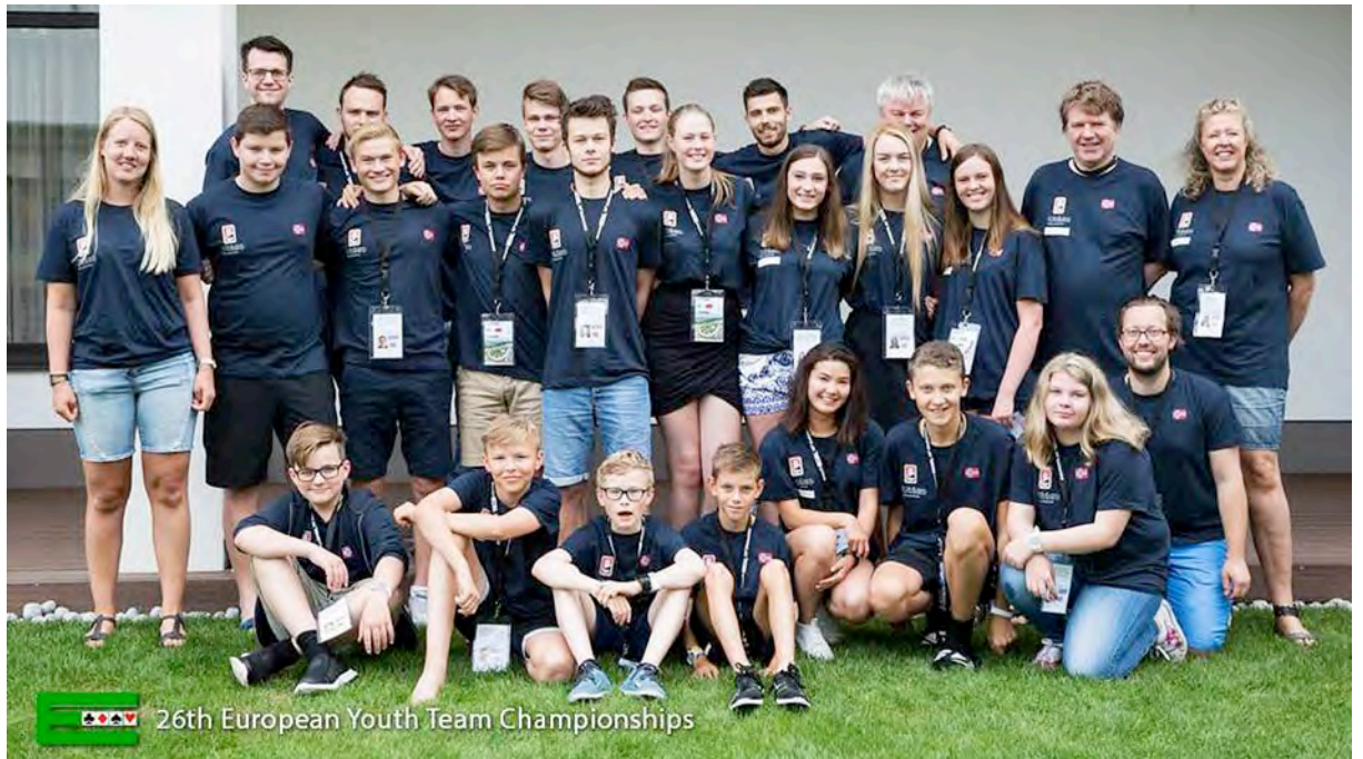
Noreg stile med ein stor tropp og lag i alle fire klassane under ungdoms-EM i Slovakia juli 2017.