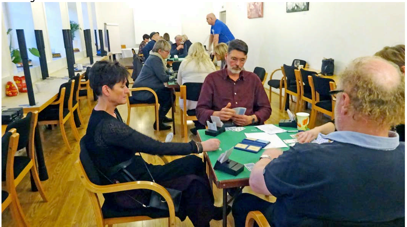
Spelesalen på Herdla