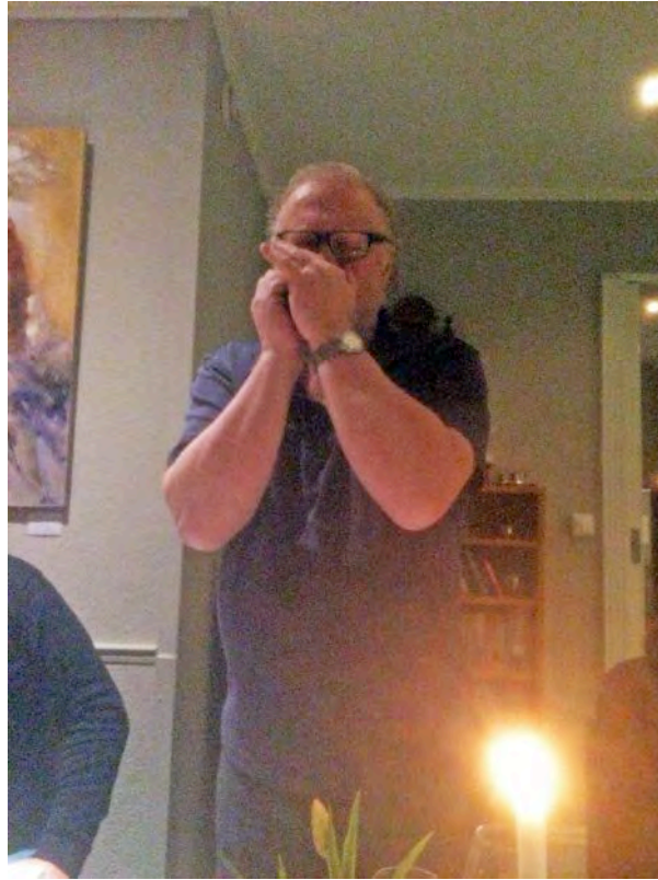
"Per spelmann" under middagen laurdag kveld