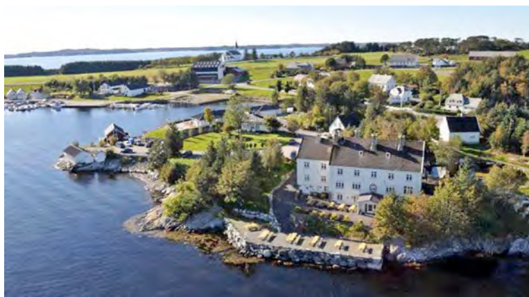
Eit sommarbilete frå Herdla