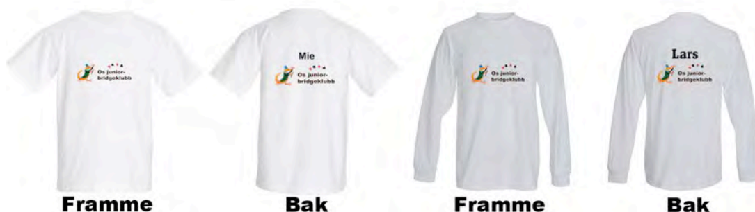
Juniorklubben stiller i egne drakter

Under følgjer nokre bilete frå spelinga i juniorklubben. Rapport om bruk av midlane er òg sendt NBF. Rapporten er lagt på nettsida vår og kan lesast der.