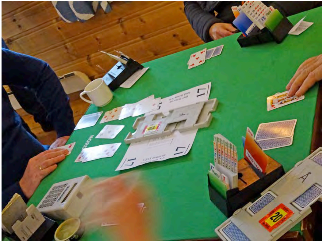
Livet er kort.