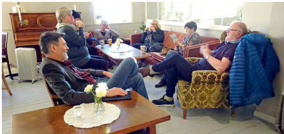
Samling i salongen